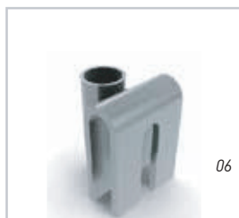
01 - New Jersey Angular e New Jersey Reta 02 - Clips 03 - Perfil VL5 04 - Barra de Ancoragem 05 - Porca de Ancoragem 06 - Othal